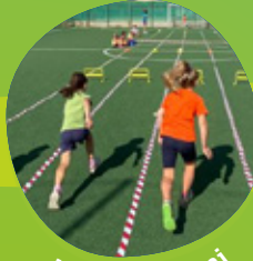
KIDS 6-11 anni