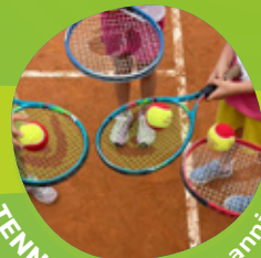
TENNIS/PADEL 6-15 anni