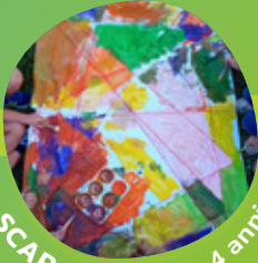
SCARABOCCHI 3-4 anni