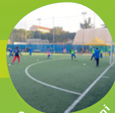
CALCIO 6-15 anni