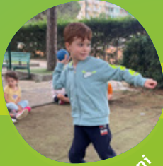
CINQUE 5 anni