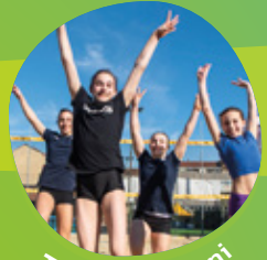
TEEN 12-15 anni